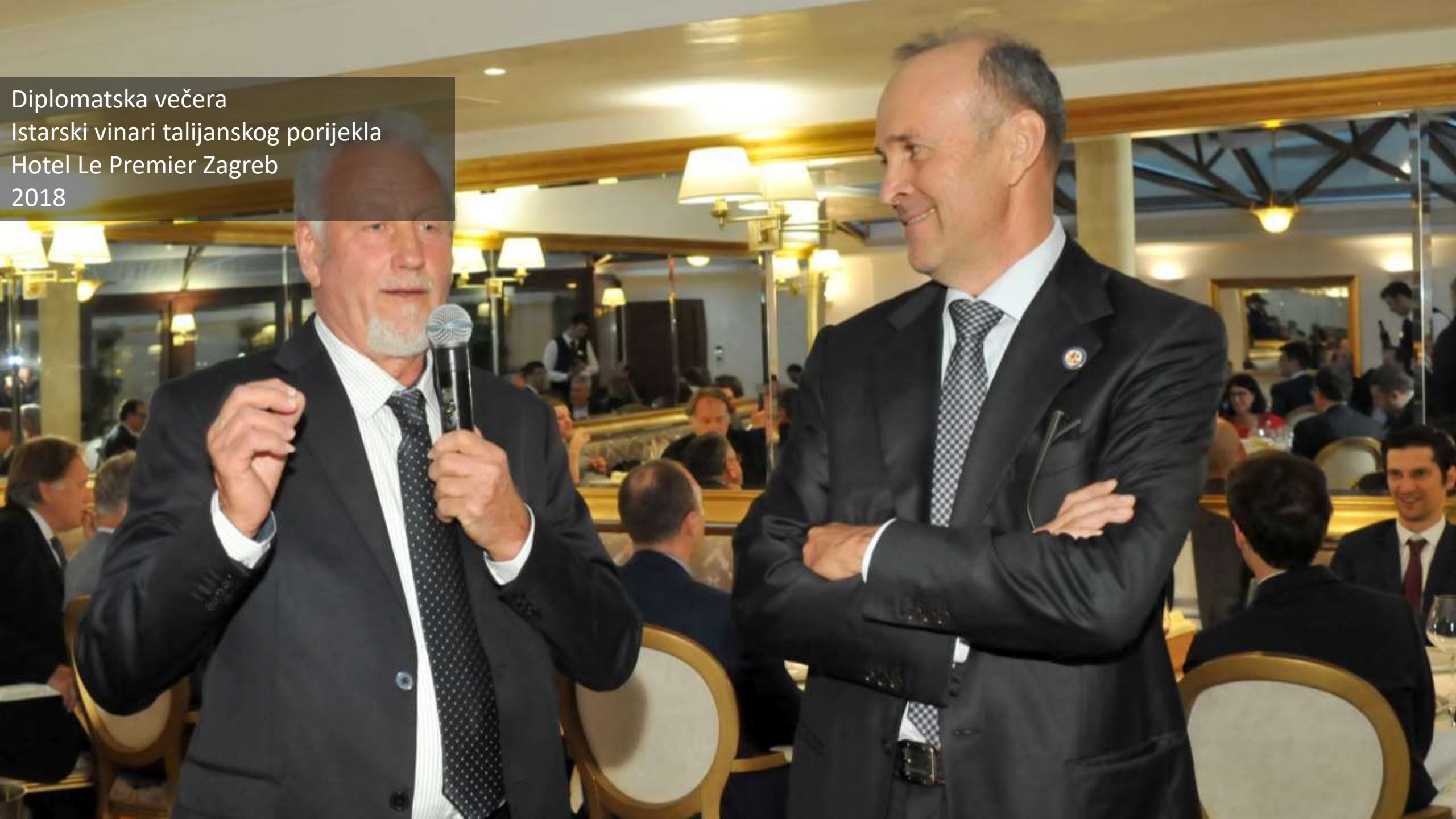
Diplomatska večera Istarski vinari talijanskog porijekla Hotel Le Premier Zagreb 2018