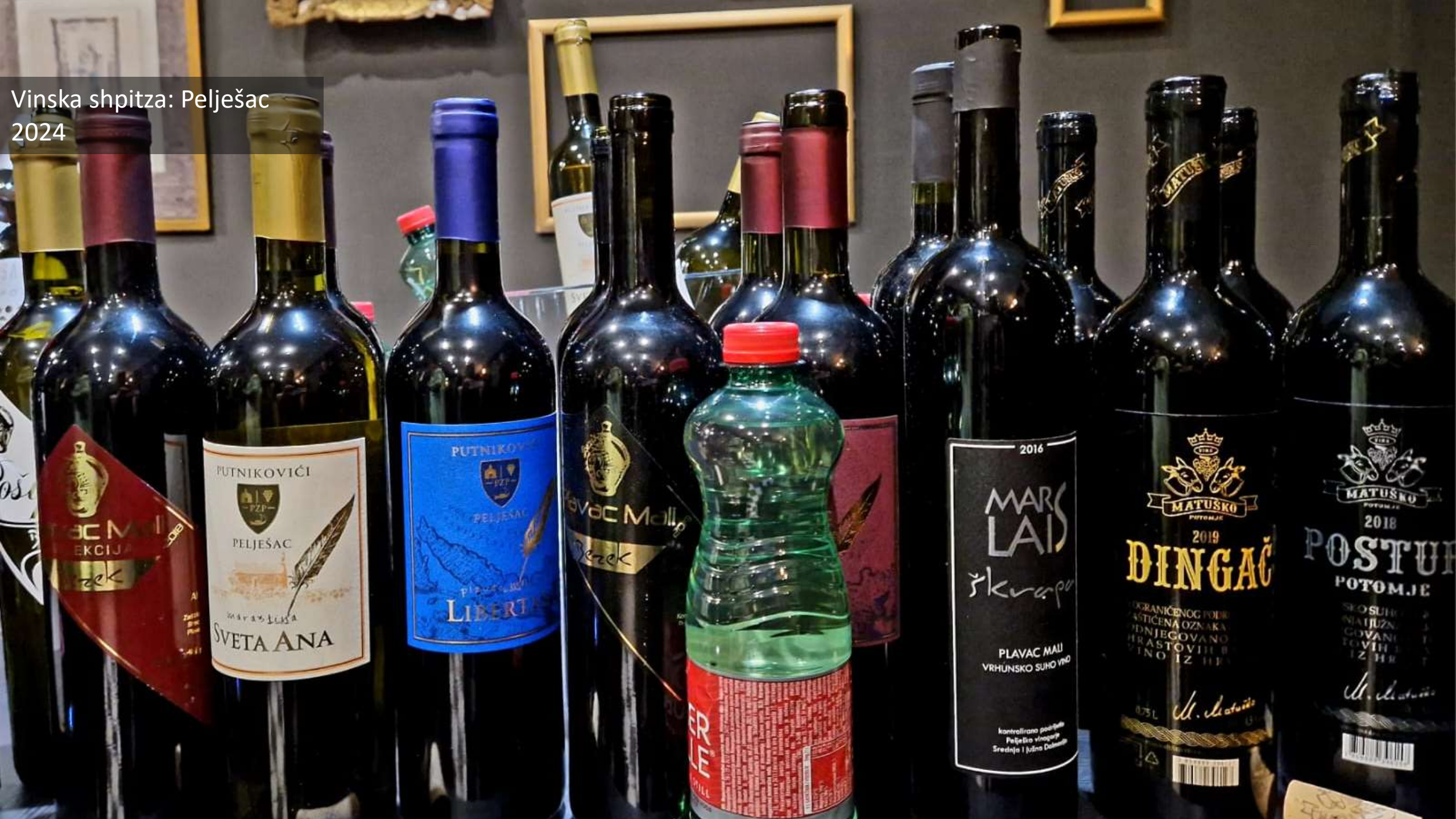
Vinska shpitzza: Pelješac 2024